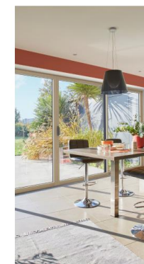
BAIES COULISSANTES BOIS-ALUMINIUM