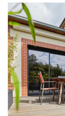
PRODUITS CONNECTÉS MÉO CONNECT