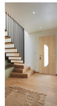
PORTES D'ENTRÉE BOIS-ALUMINIUM