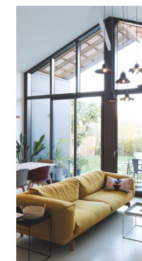
VERRIÈRES & MURS RIDEAUX BOIS-ALUMINIUM