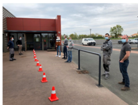
Possibilité à l'arrivée d'orienter les salariés vers la zone vestiaire par l'extérieur tout en respectant les distances de sécurité.

Dans le cadre du redémarrage et afin de garantir à tous un haut niveau de sécurité face au Coronavirus, les équipes de sécurité et de production MÉO ont imaginé et mis en place un plan de sécurité sanitaire strict dans les usines, conformément aux recommandations du gouvernement.