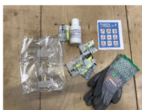
Kit individuel avec EPI, gel hydroalcoolique, bouchons d'oreilles, gants.