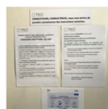
Panneau de consignes pour les chauffeurs et les livraisons.