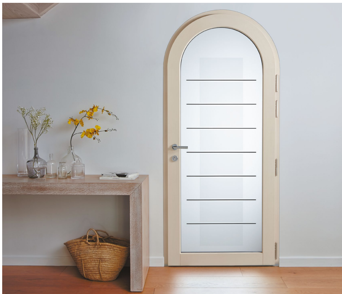
MERCURE Finition pin sablé, poignée standard ton inox