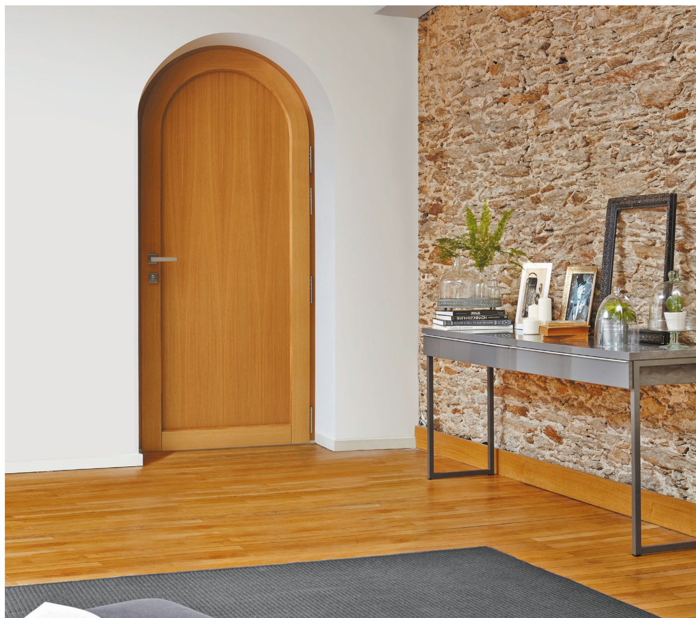
RIVIÈRE Finition chêne naturel, poignée optionnelle sur rosace carrée ton inox